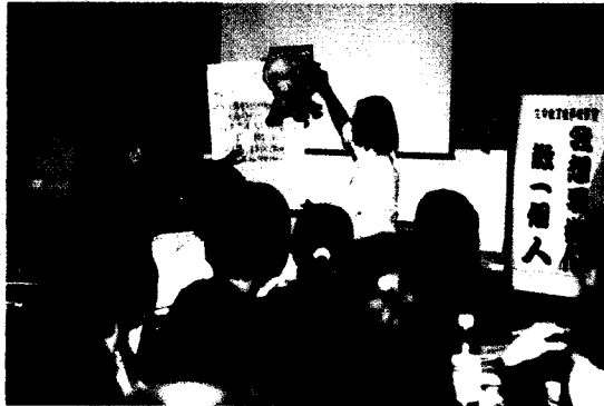
泰山文化基金會辦理生命教育教學研習：我想要如何教一個人